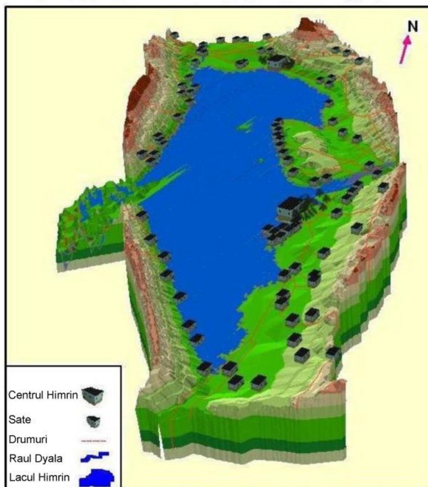
Fig. 3. Distribuția așezărilor umane după construirea barajului Himrin.

districte amplasate în trei mari zone agricole (Kara Tepe, Saadia și Jalawla) așa cum se arată în Fig. 2 și Fig. 3.