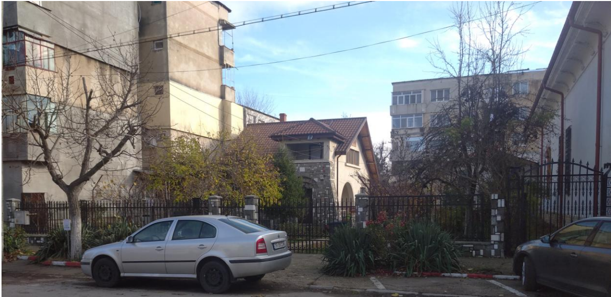
Fig. 1. Fragment din ansamblul urban protejat „strada Avocat Colfescu” - restructurare zonă central prin construirea de locuințe colective.

niveluri, rămâne cea între anii 1968-1989, când au fost restructurate aproape complet atât zona centrală, cât și zonele limitrofe celor două axe importante de circulație- strada Dunării și strada București. Deși fenomenul urbanizării a avut drept scop declarat îmbunătățirea condițiilor de locuit, rezultatul nu a fost cel așteptat. Gruparea unui număr mare de indivizi pe suprafețe foarte mici a determinat scăderea calității locuirii prin numărul mai mic de camere și lipsa spațiului verde absolut necesar unei gospodării individuale și implicit schimbarea stilului de viață. S-a creat în schimb un mediu în care accesul la dotări superioare de ordin economic și social este facil, crescând gradul de confort, prin echiparea noilor locuințe cu instalații de apă curentă și canal, electricitate și încălzire centrală 4 .