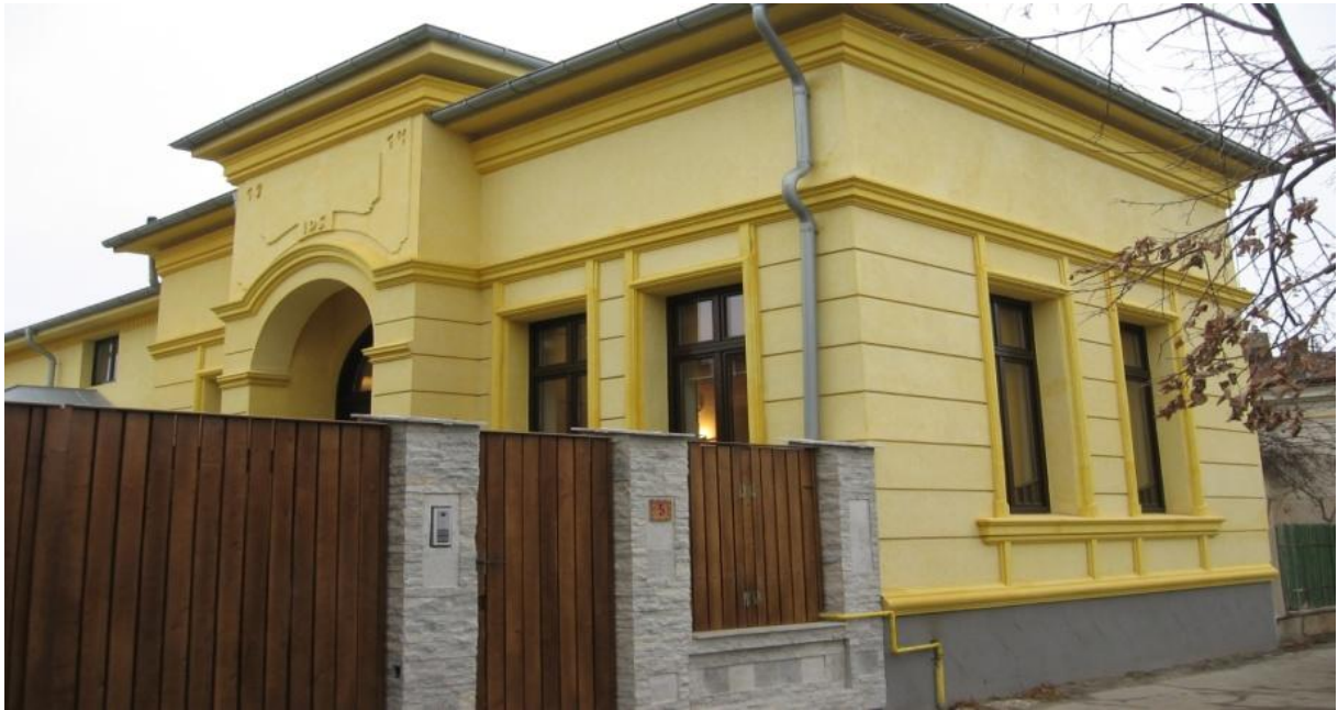
Fig. 4. Casa Marin Stoica de pe strada avocat Al. Colfescu, nr. 5, monument istoric cu cod LMI TR-II-m-B-14240- intervenții suprainălțare.

clasate, doar casa Eusevie Crocos (strada Cuza Vodă 37) se mai păstrează în forma inițială, deși starea de conservare este precară, imobilul fiind practic abandonat.