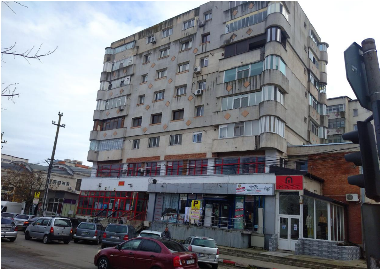
Fig. 2. Fragment din Ansamblul Urban „strada Constantin Brâncoveanu”, clasat cu cod LMI TR-II-a-B-14235- aspectul architectural al centrului comercial afectat de reconfigurarea haotică a spațiilor comerciale de la parterul și mezaninul blocurilor.

Perioada post 1990 reprezintă o perioadă de dezvoltare organică a țesutului urban, cu dezvoltări punctuale ale zonelor periferice, destructurate, cu precădere prin introducerea construcțiilor de dimensiuni medii și mari destinate activităților comerciale în lungul străzii București, în partea de est și conversia fostelor unități industriale, în partea de sud a străzii Dunării și și prin extinderea zonelor rezidențiale către nord și est. Ulterior anului 1990 dezvoltarea economiei municipiului Alexandria s-a transpus în pierderea statutului de oraș monofuncțional, bazat pe industrie, diversificarea profilului economic al acestuia, prin amploarea pe care au luat-o activitățile comerciale.