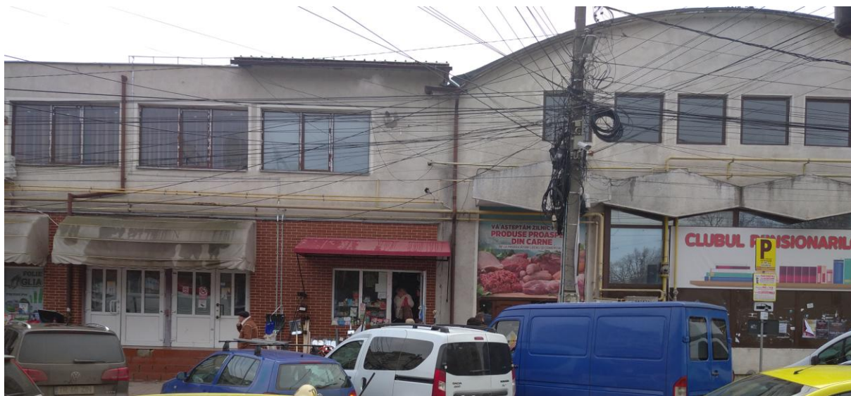
Fig. 3. Monumentul istoric "Hala Veche", cod LMI TR-II-m-B-14259.

devenit capitala județului Teleorman- pe suprafețe foarte mici, prin realizarea de locuințe colective, în urma demolării unor zone întregi construite.