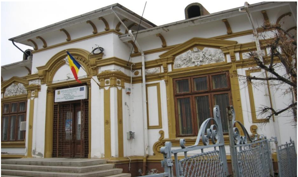
Fig. 5. Casa Anghel Capră, fostul sediu al Camerei Agricole Teleorman, strada Constantin Brâncoveanu, numărul 71, cod LMI TR-II-m-B-14247- intervenții minore, utilizarea neinspirată a cromaticii.

Celelalte două, Casele Nae Constantinescu (str. Dunării 173) și Marin Vasilescu (str. Dunării 190), înconjurate de ansambluri moderne, rămân practic măturii ale trecutului urbanistic al orașului, punând în valoare, în mod paradoxal, simplitatea și eleganța stilului în fața unor materiale opulente precum marmura și sticla.